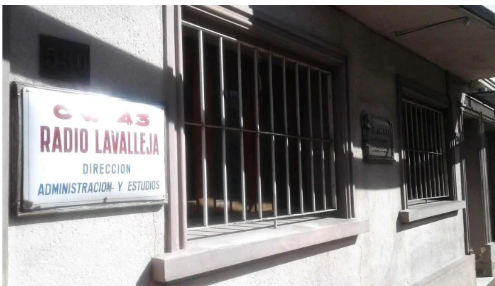
Cw43 radio lavalleja numero