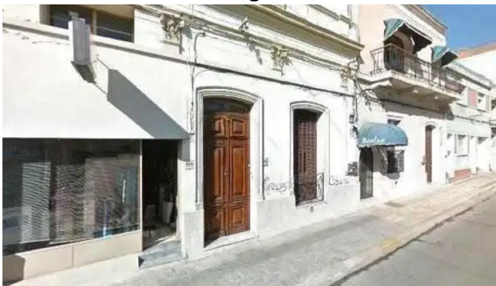
Cw43 radio lavalleja numerodeg