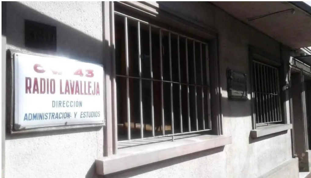
Cw43 radio lavallega minas