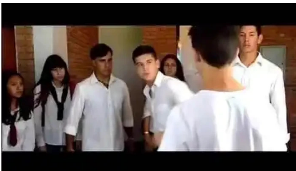
Adeom fm 985 videos