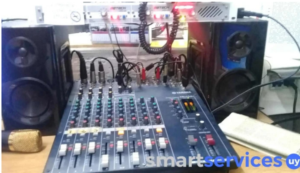
Adeom fm 98 5 minas