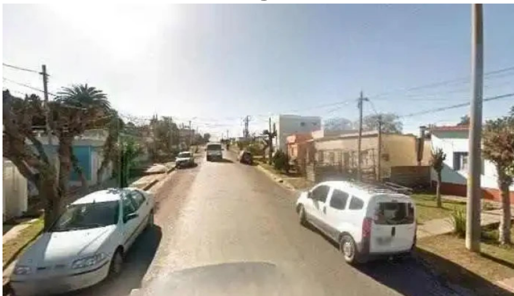
Adeom fm 985 videosdeg