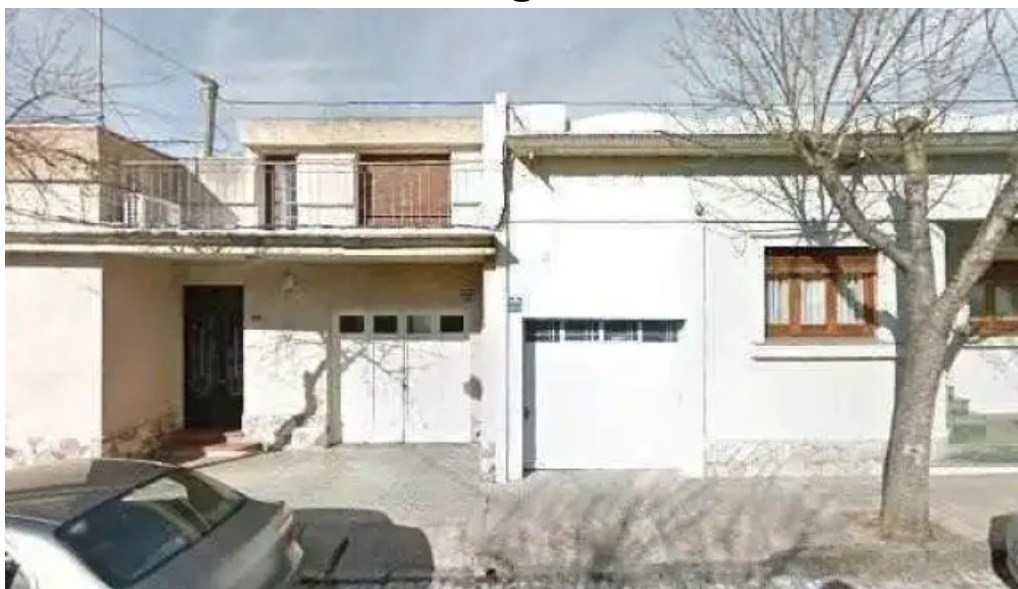
Difusora soriano precios