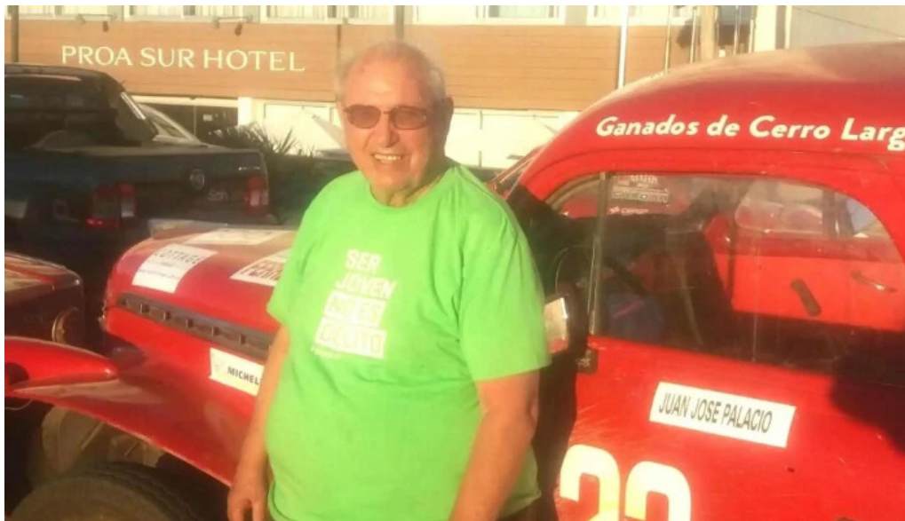
Radio acuarela de cerro largo instagram