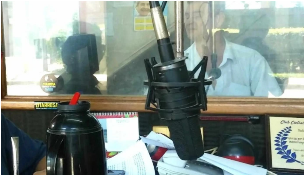
Radio acuarela de cerro largo telefono