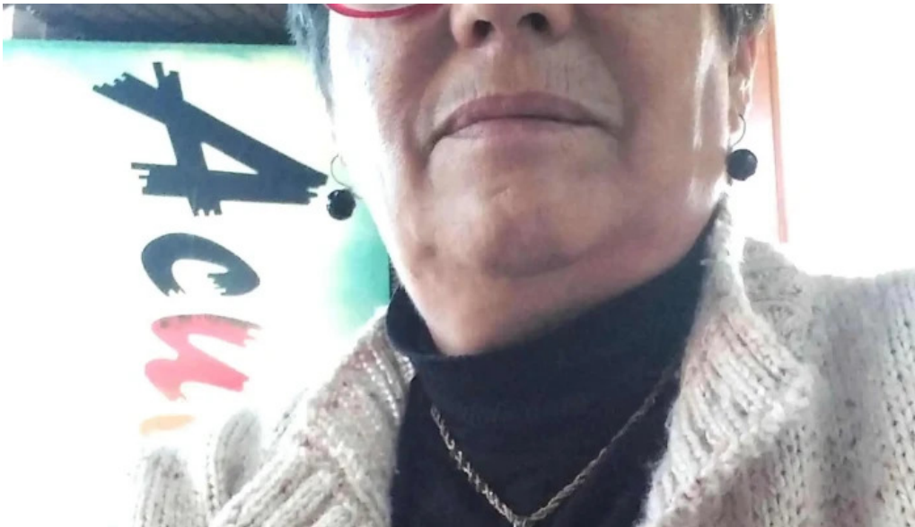
Radio acuarela de cerro largo promocion