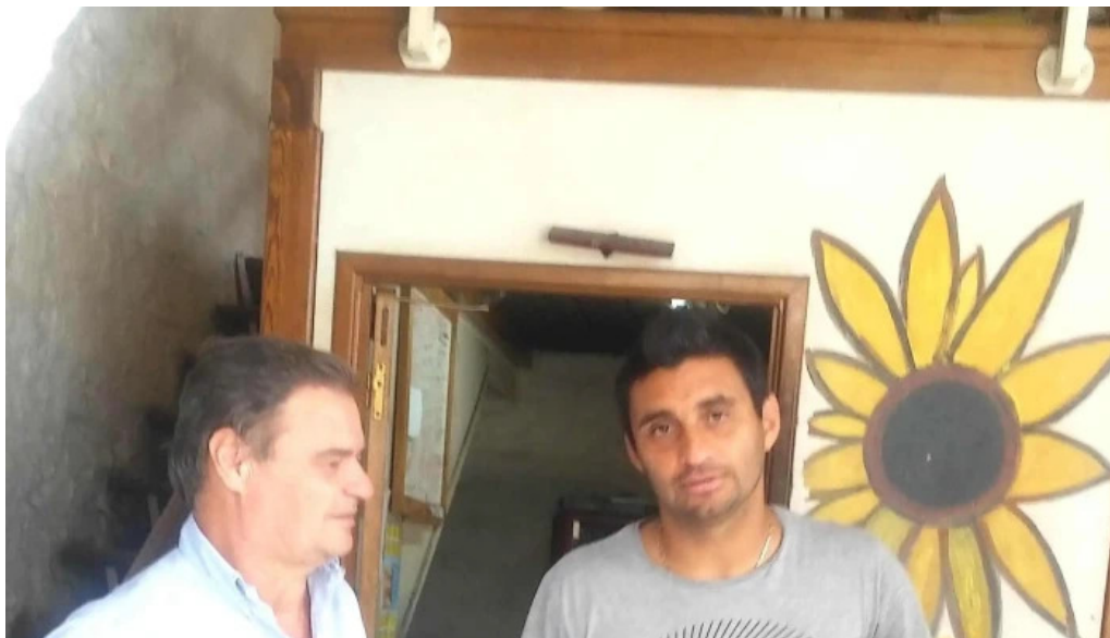
Radio acuarela de cerro largo fotos