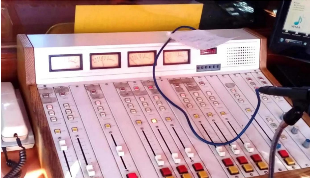
Radio cristal del uruguay 1470am horario