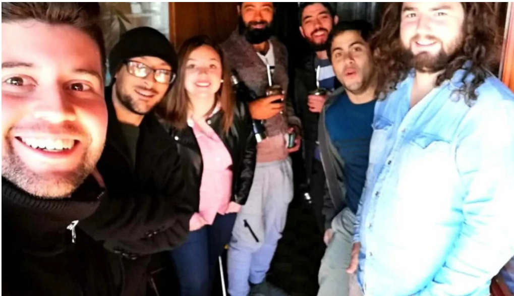
Radio cristal del uruguay 1470am catalogo