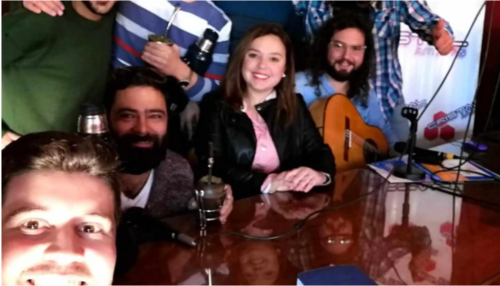
Radio cristal del uruguay 1470am videos