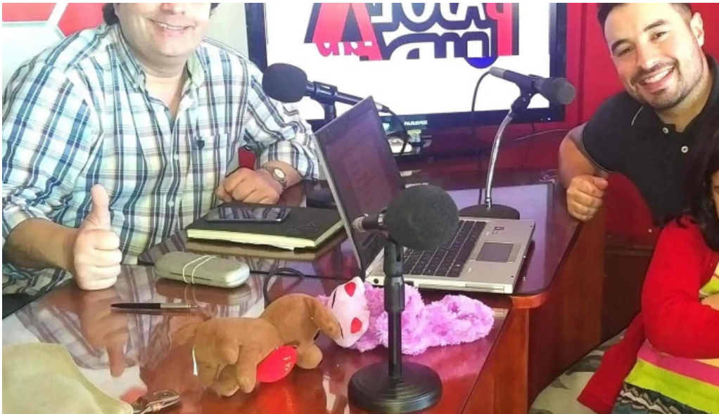
Radio cristal del uruguay 1470am numero