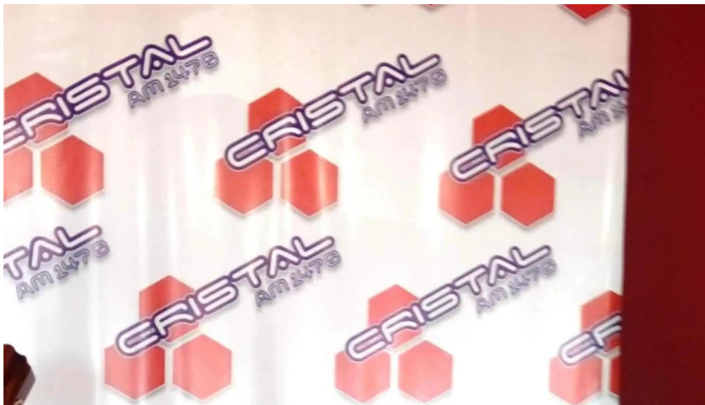
Radio cristal del uruguay 1470am las piedras