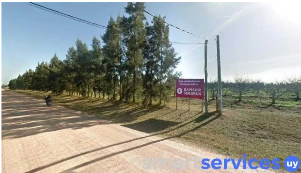
Planta emisora de cx 147 radio cristal las piedras