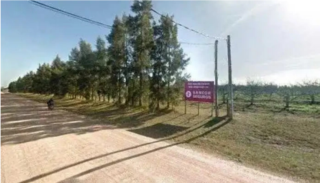
Planta emisora de cx 147 radio cristal ubicacion