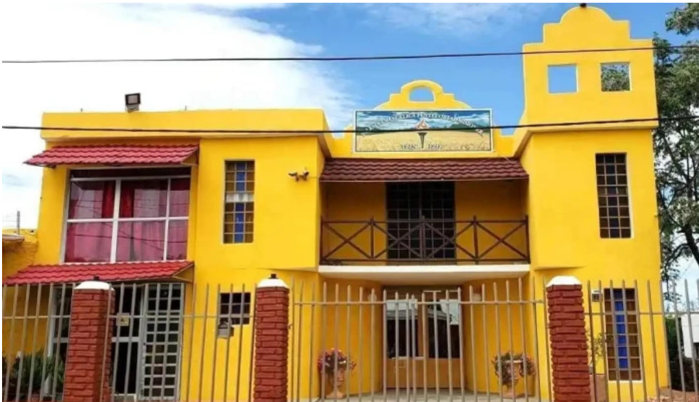
Ebenezer las piedras abierto ahora