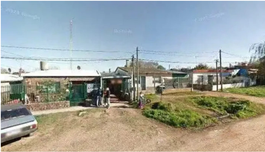
Ebenezer las piedras abierto ahoradeg