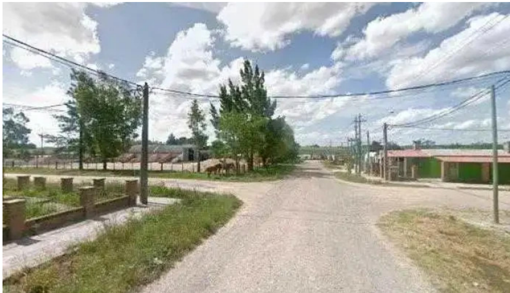
Ideas 1053 fm fotos