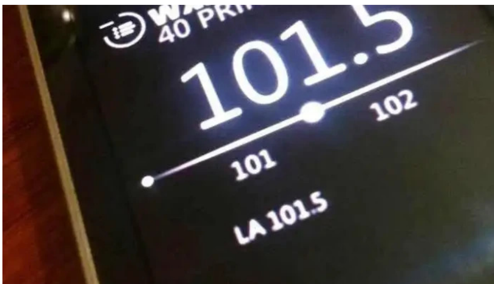
Integracion fm 101 5 acegua