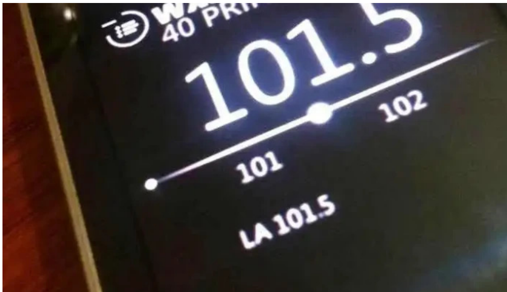
Integracion fm 1015 puntaje