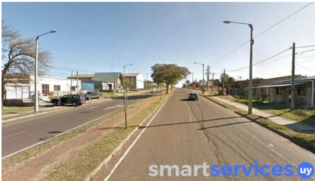
Punto led salto