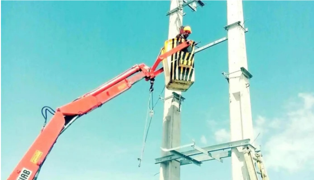
Electricistas unidos del propietario