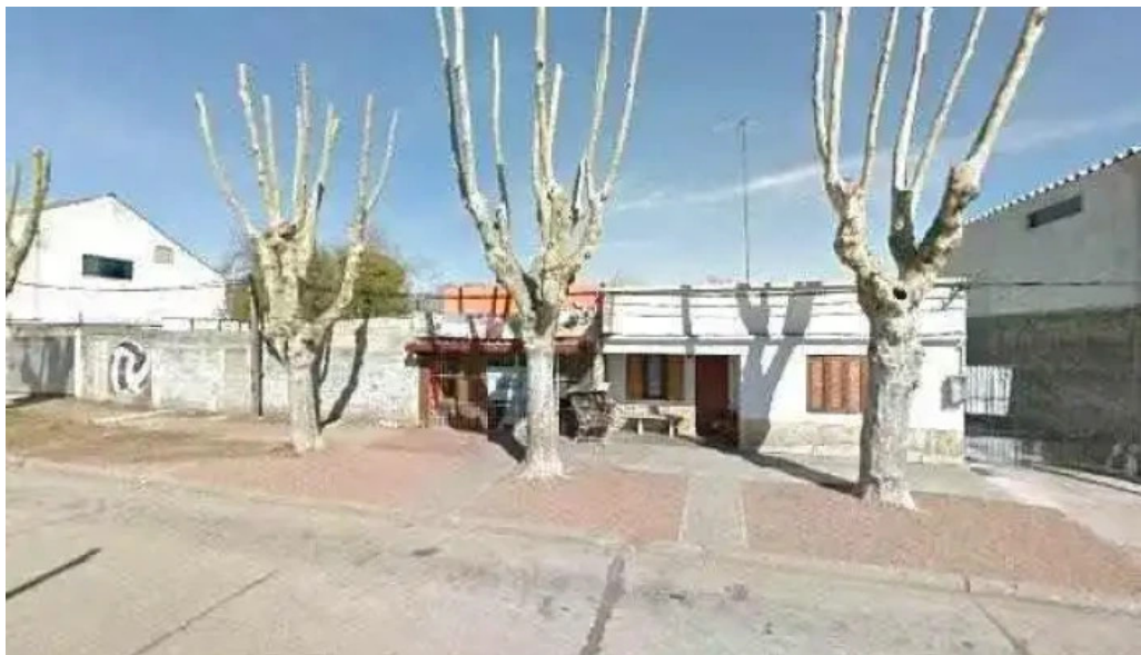
Electricistas unidos electricistas