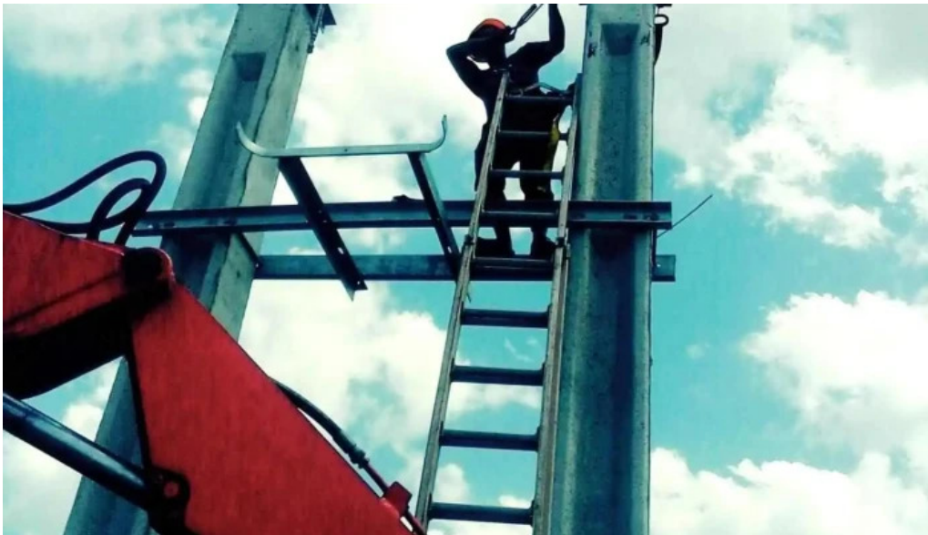
Electricistas unidos accesibilidad