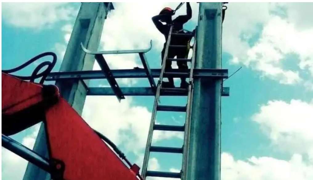
Electricistas unidos pando