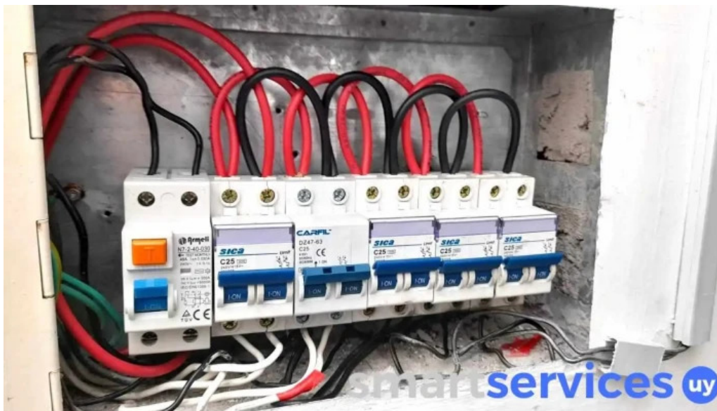
Jp binaghi tecnico electricista aut ute montevideo