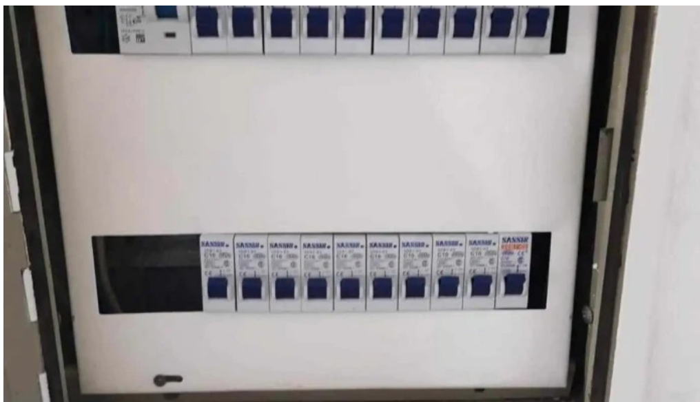
Jp binaghi tecnico electricista aut ute del propietario