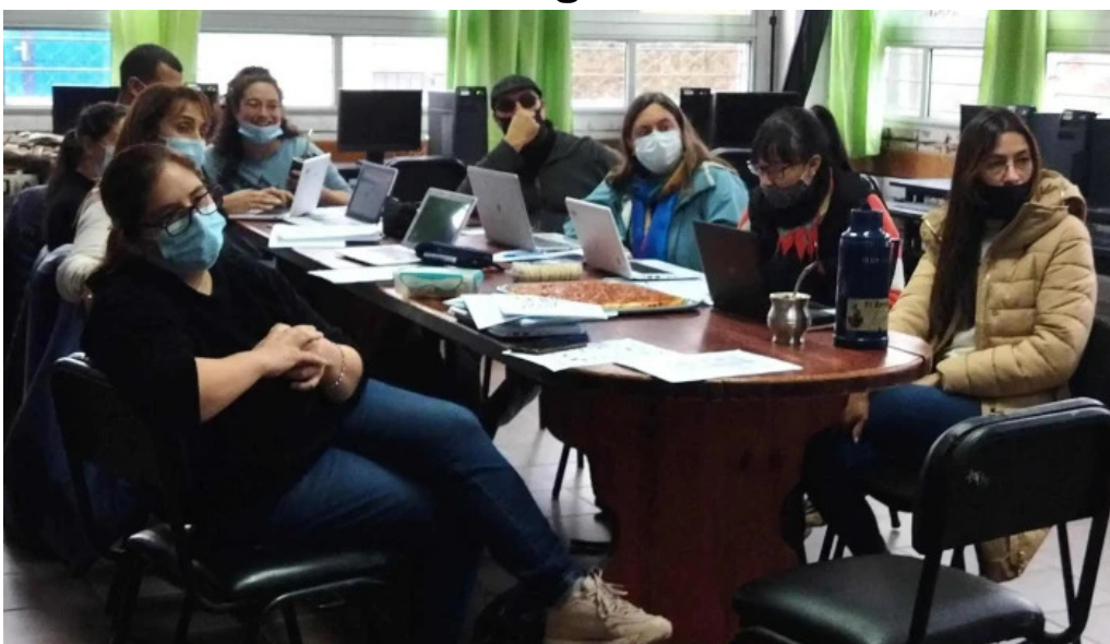
Liceo alvaro figueredo zona