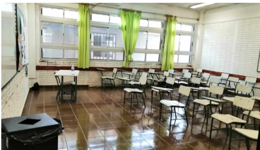
Liceo alvaro figuereo aula