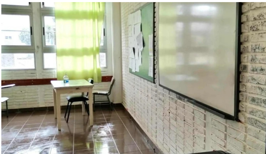
Liceo alvaro figuereo donde