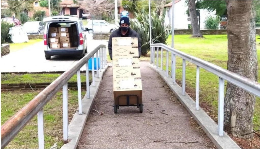
Liceo alvaro figuereo instagram