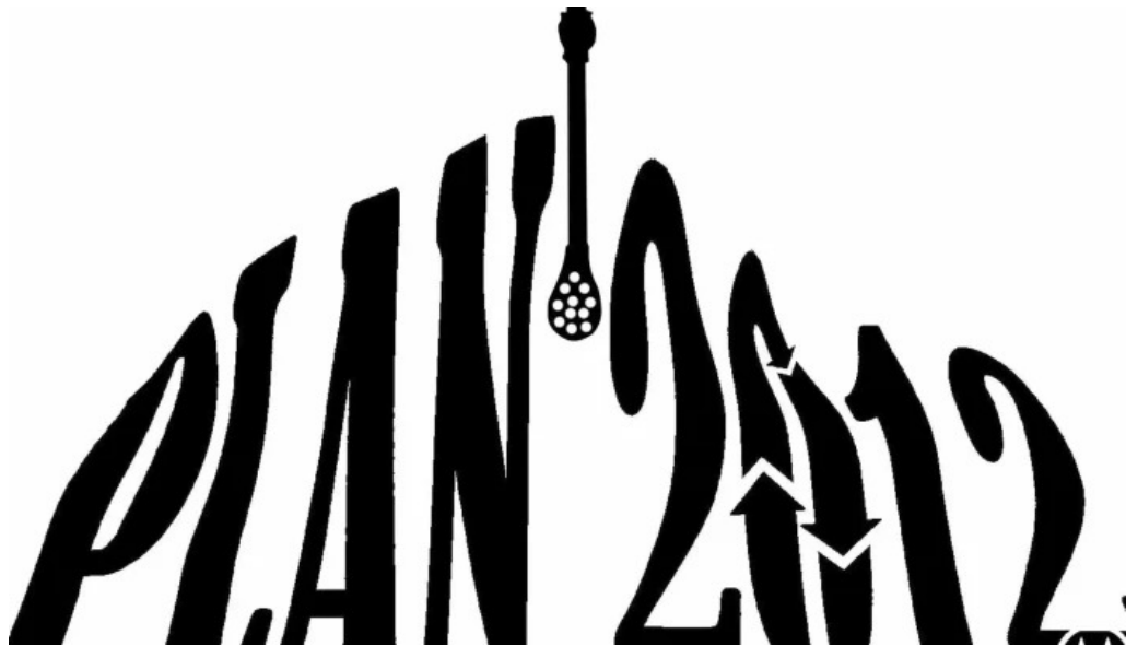
Liceo alvaro figuero pan de azucar