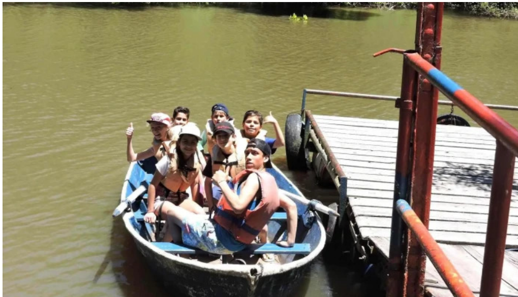
Saint catherines school opiniones