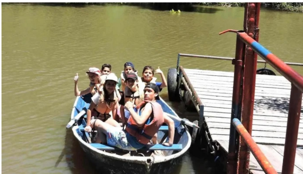
Saint catherine s school rivera