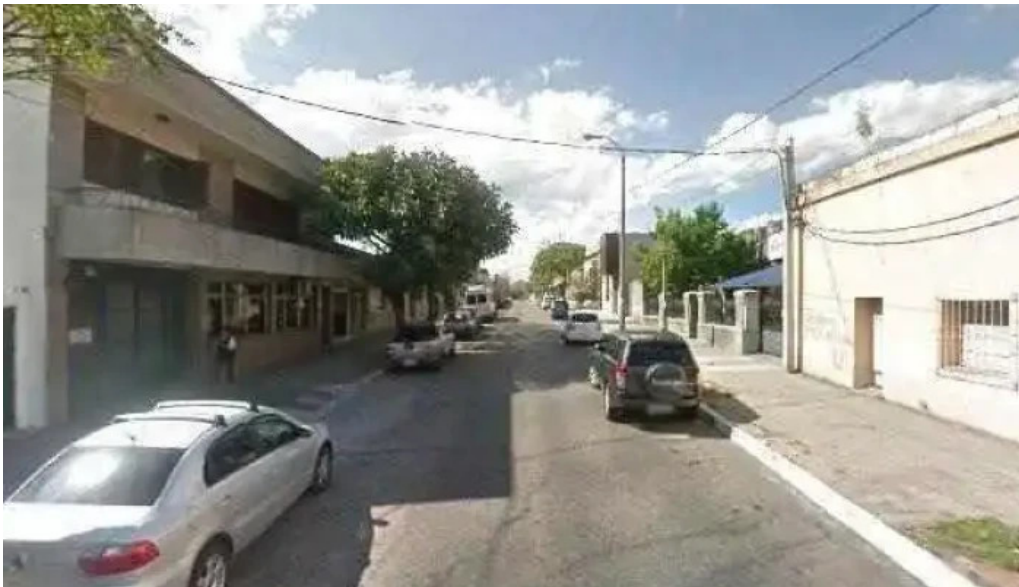
Saint catherines school opinionesdeg