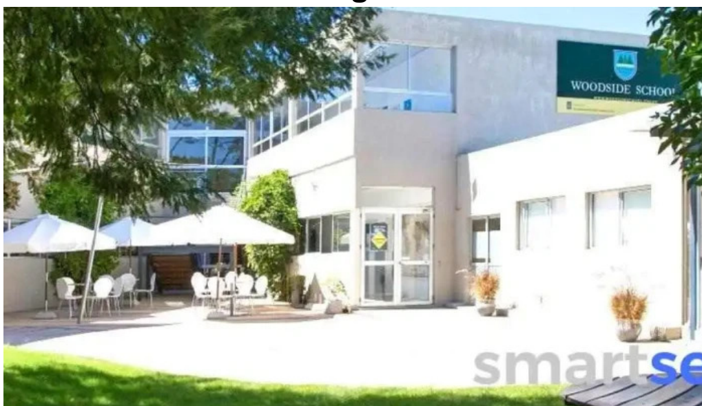
Woodside school ubicacion