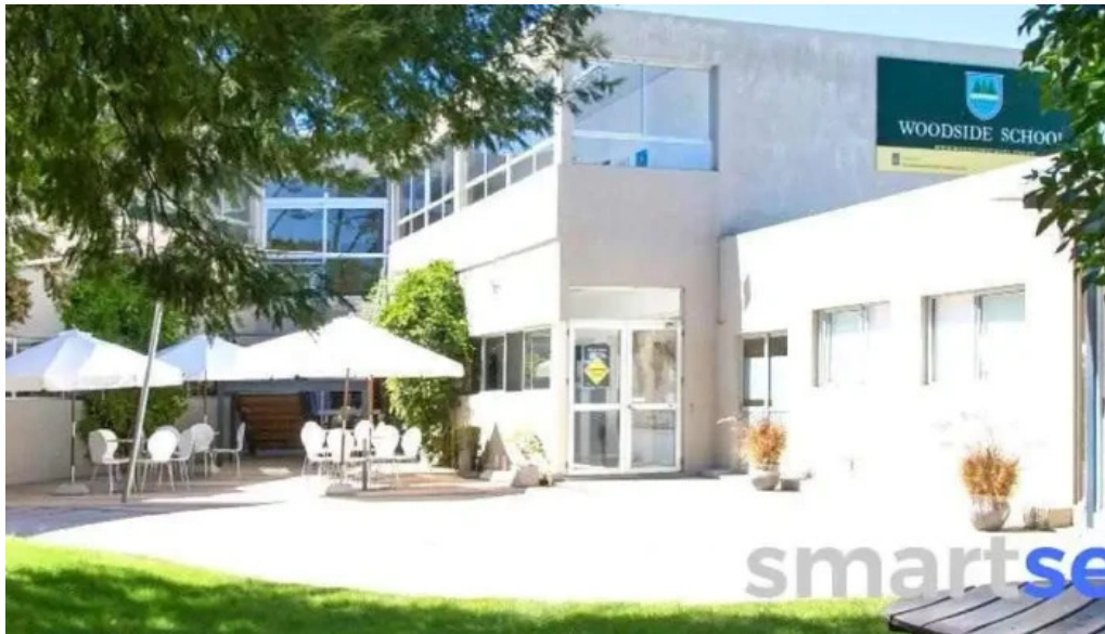
Woodside school punta del este