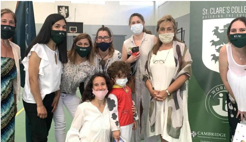
St clares college puntaje