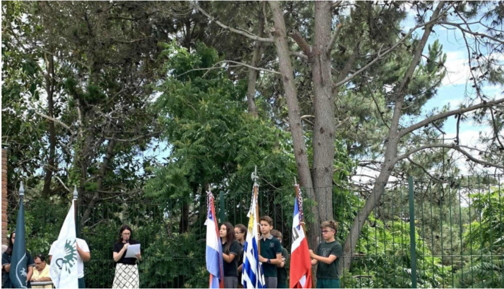
St clares college videos