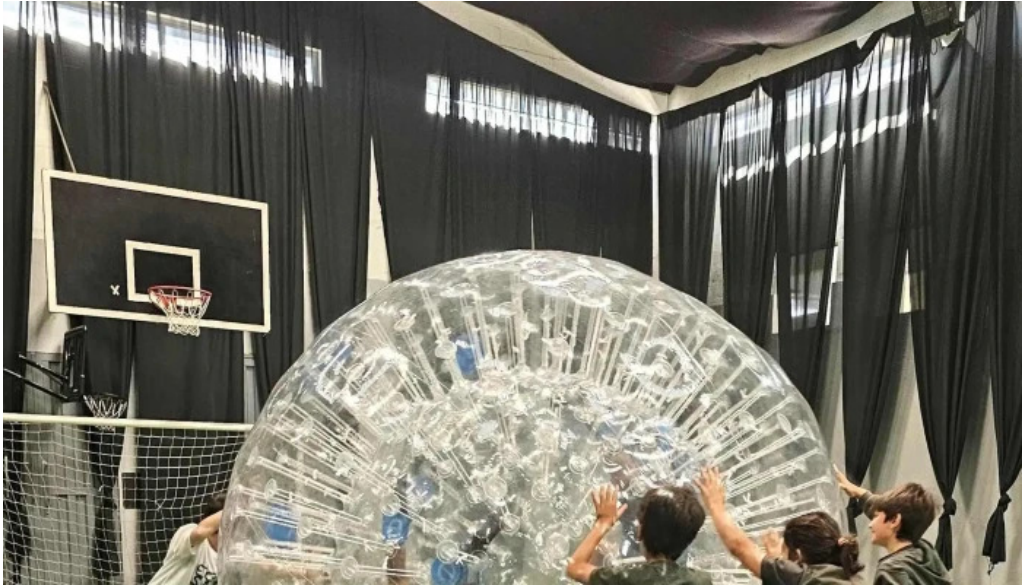
St clares college punta del este