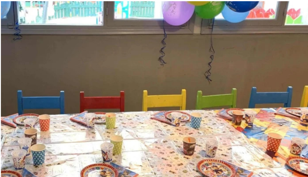
St clares college numero