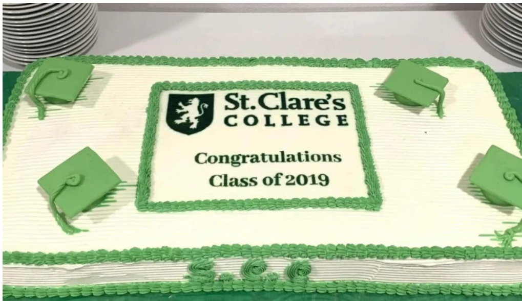
St clares college donde