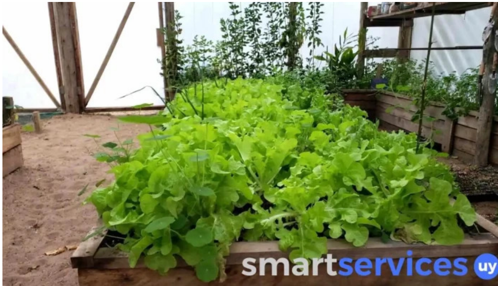
St clare s college punta del este