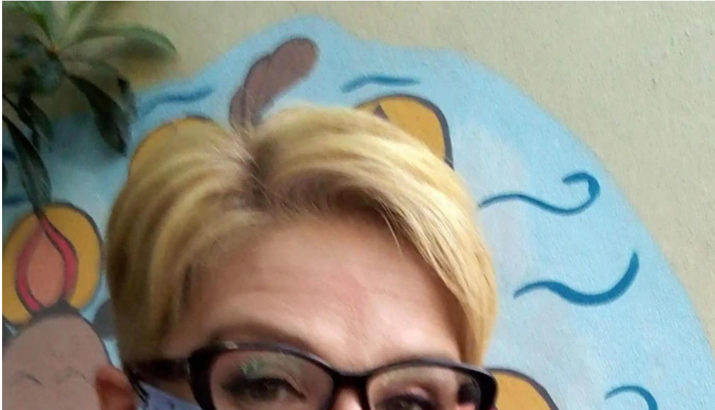
Liceo no 2 de la paz dr armando lena la paz