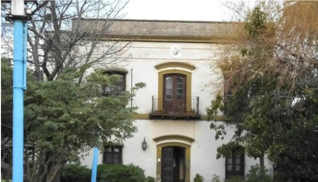
Liceo nº 2 de la paz dr armando lena la paz