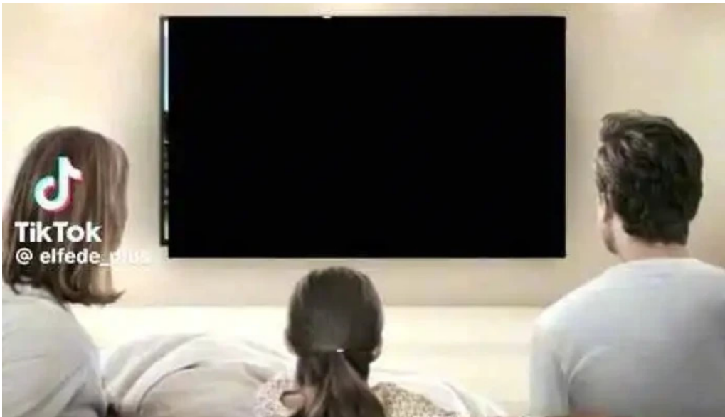
Liceo no 2 de la paz dr armando lena videos