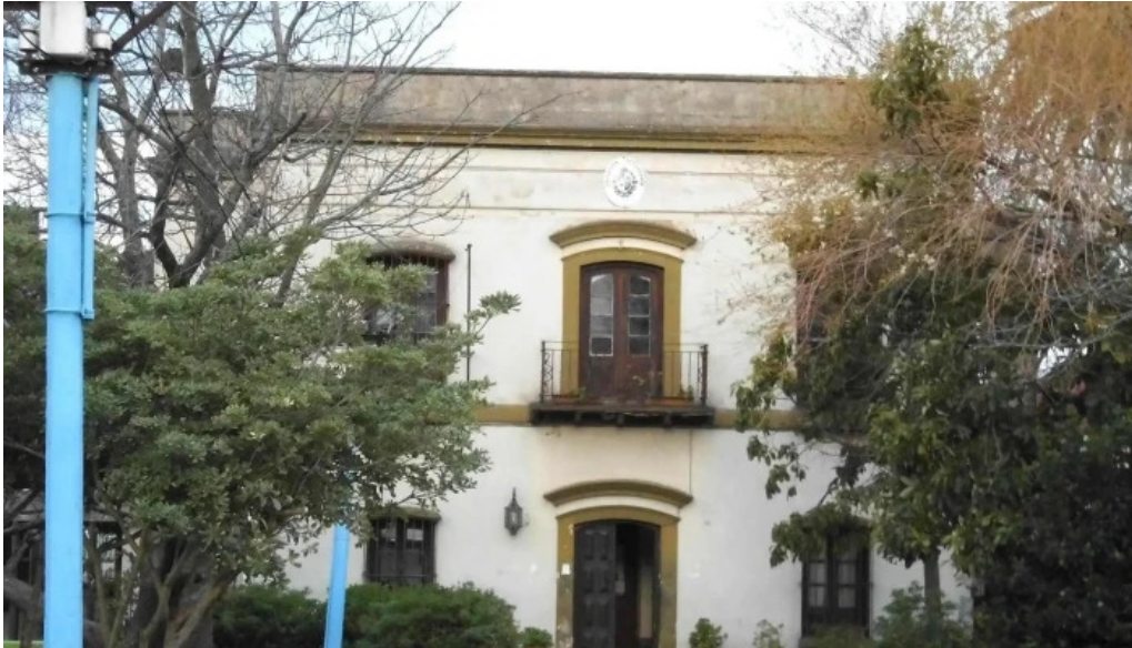
Liceo no 2 de la paz dr armando lena sitio web