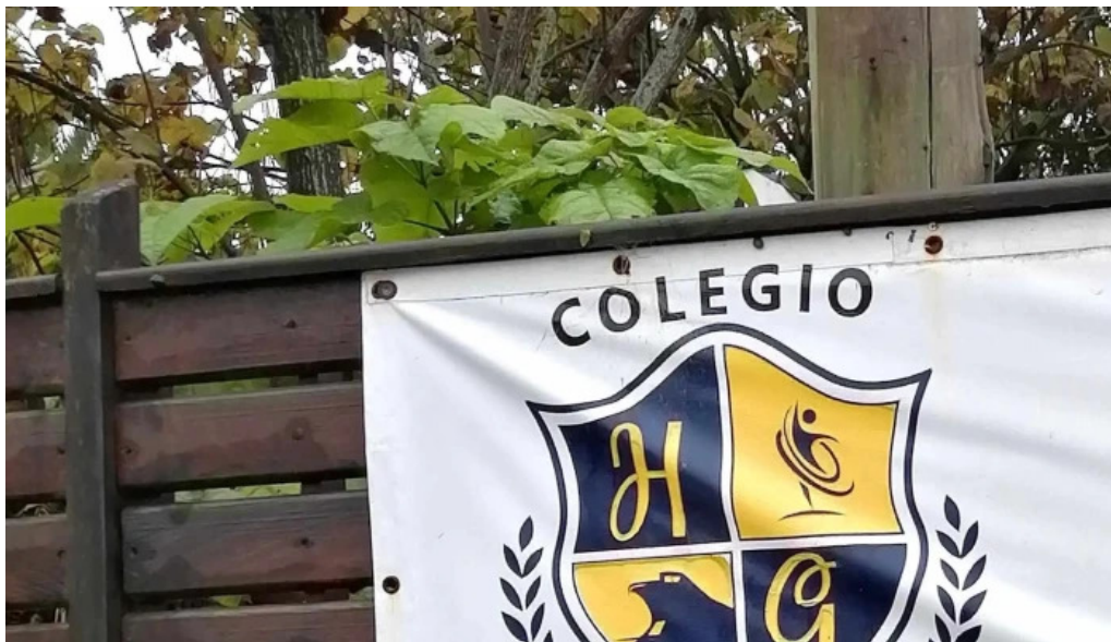
Colegio howard gardner descuentos