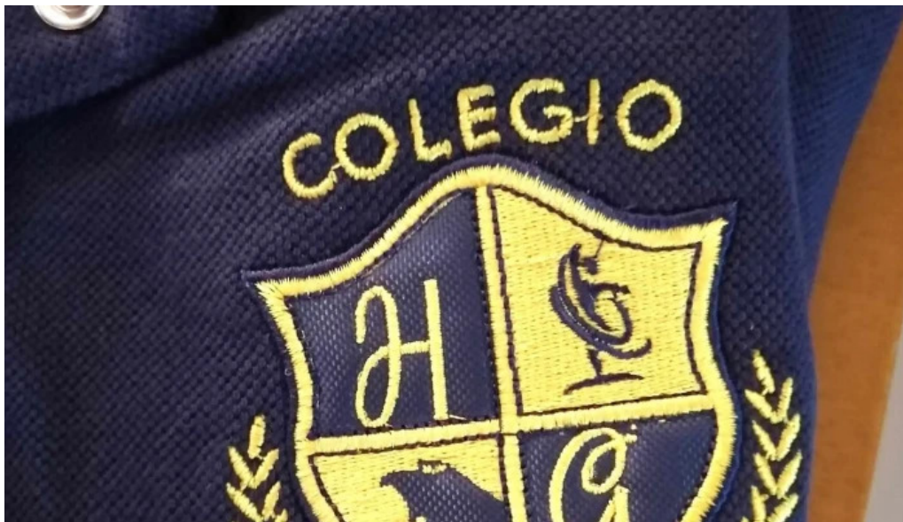
Colegio howard gardner como llegar