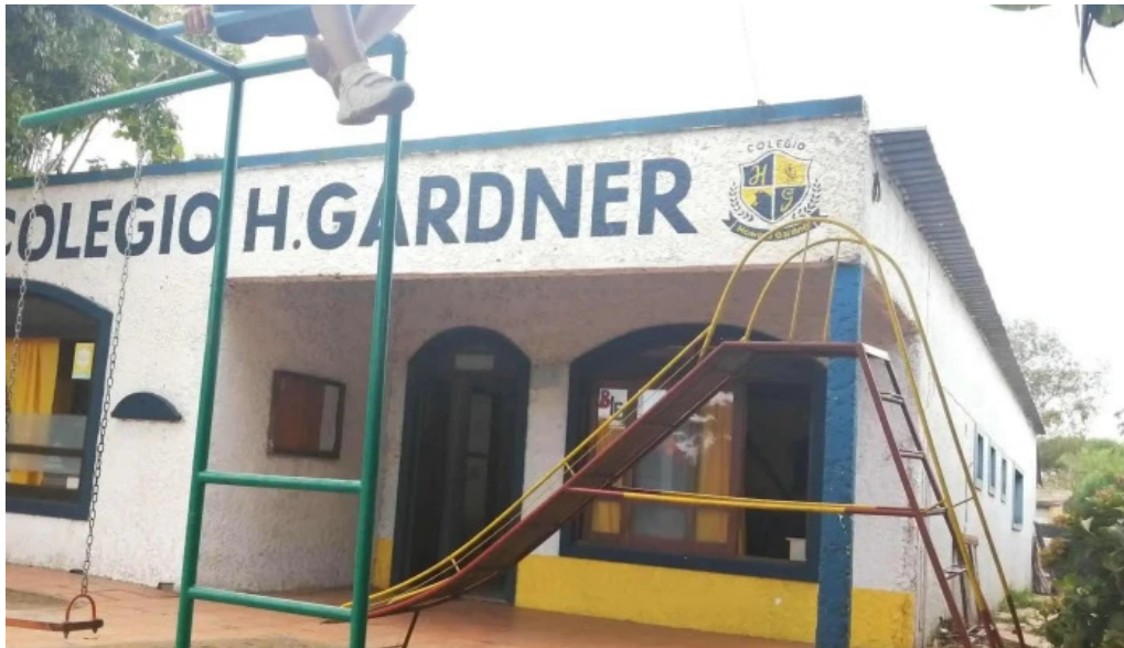
Colegio howard gardner atlantida