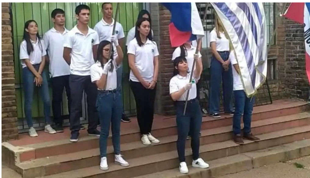
Liceo de vichadero comunidad