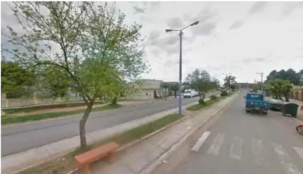
Liceo de vichadero promociondeg