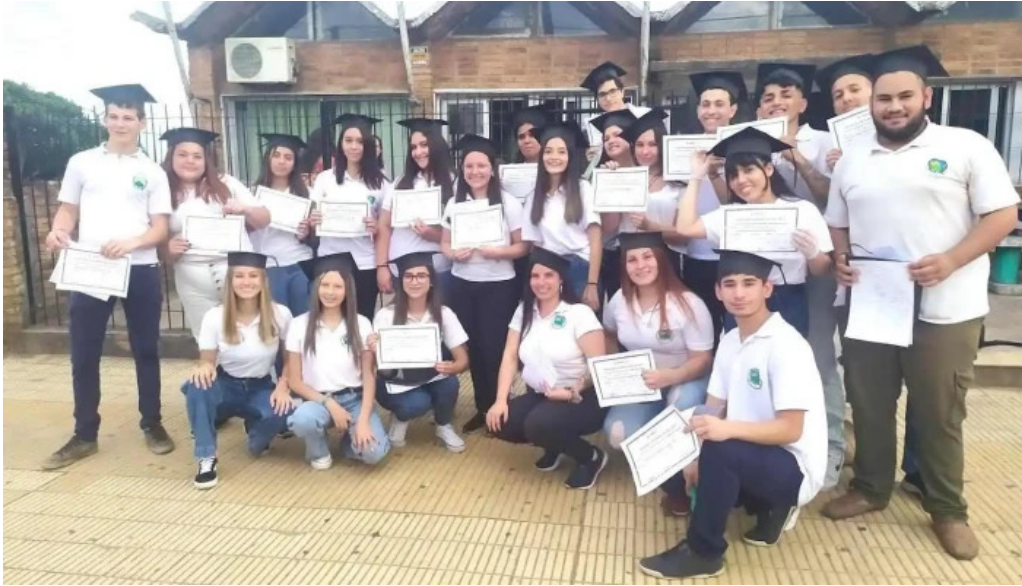
Liceo de vichadero vichadero