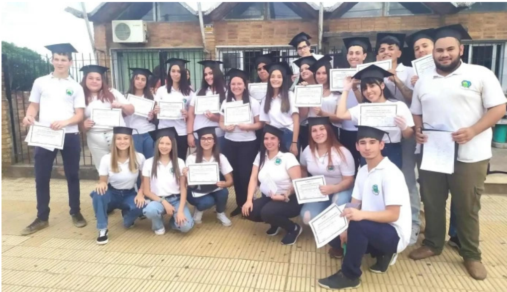
Liceo de vichadero promocion