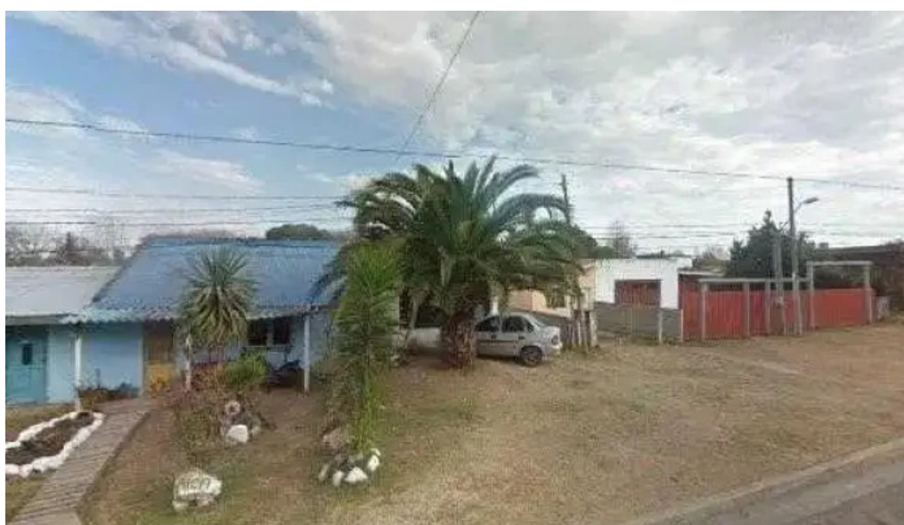
Liceo no2 Luis Barrios Tassano videos