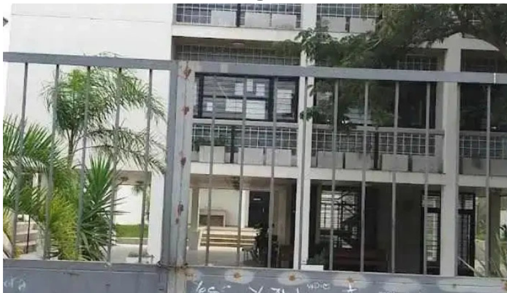
Liceo nº 4 de rivera centro maria espinola rivera