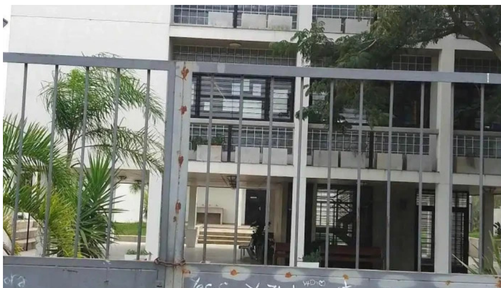
Liceo no 4 de rivera centro maria espinola zona