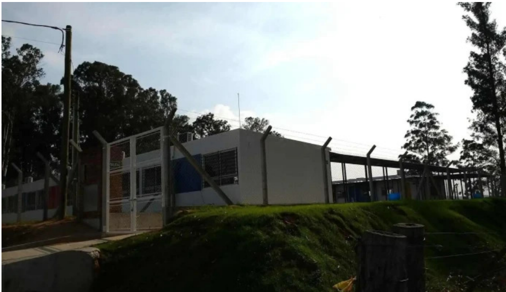
Liceo ndeg 8 instagram