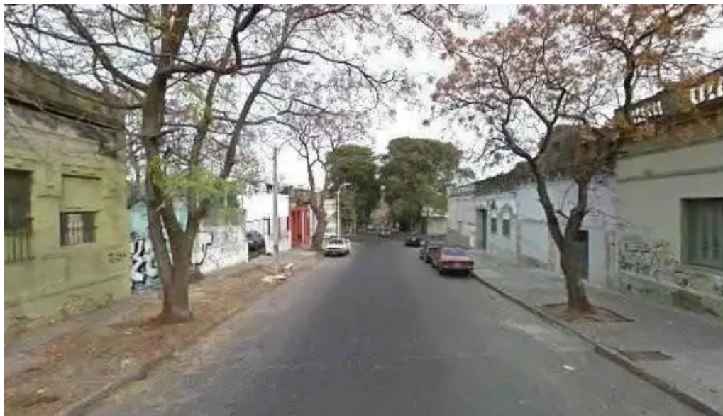
Liceo ndeg 29 alicia goyena precios