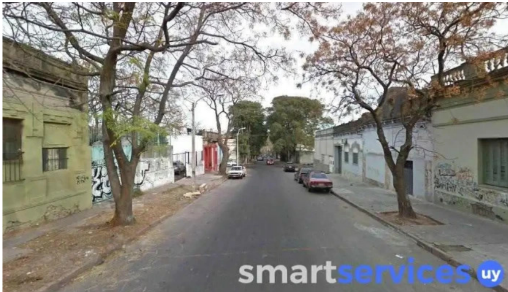
Liceo n° 29 alicia goyena montevideo