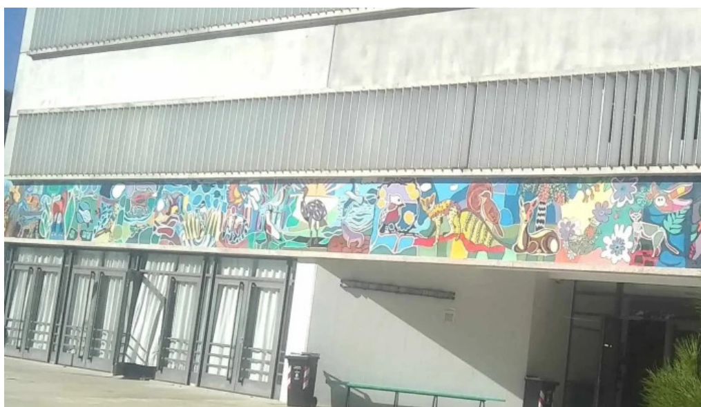
Sdlgp escuela tecnica atlantida utu atlantida