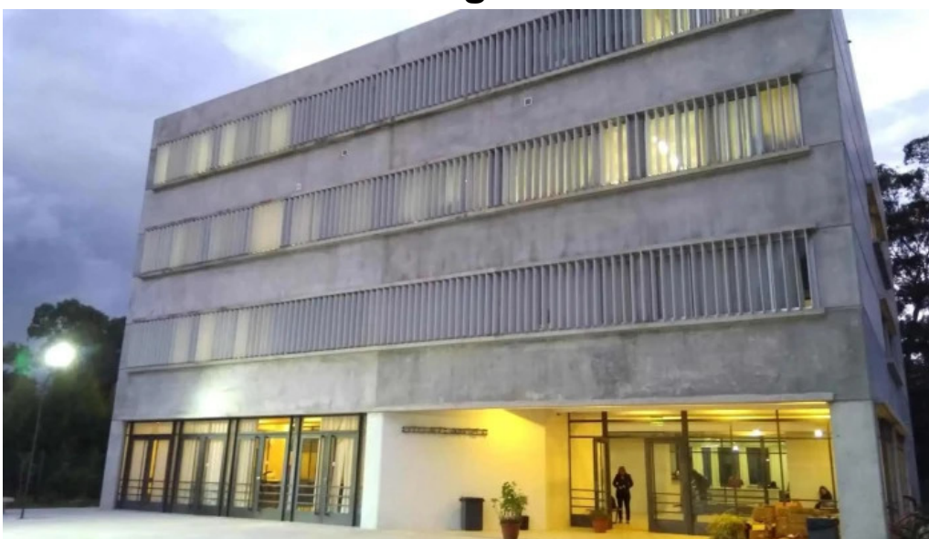
Sdlgp escuela tecnica atlantida utu puntaje