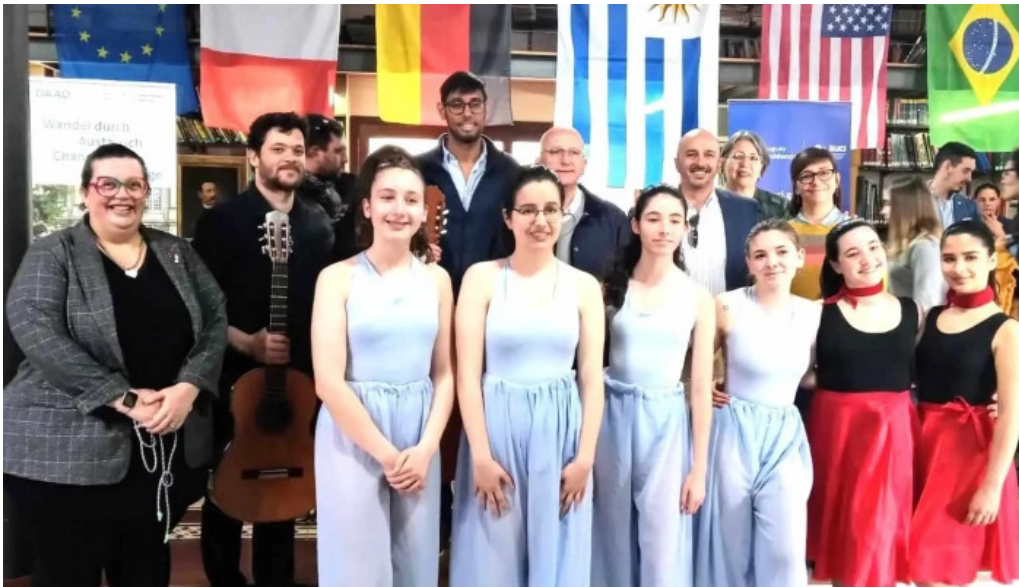
Centro cultural mem dieciocho de julio