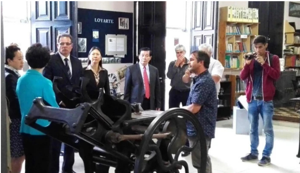
Centro cultural mem horario