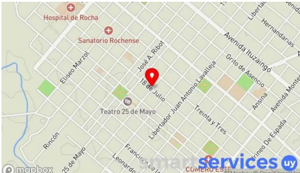
Centro cultural mem mapa