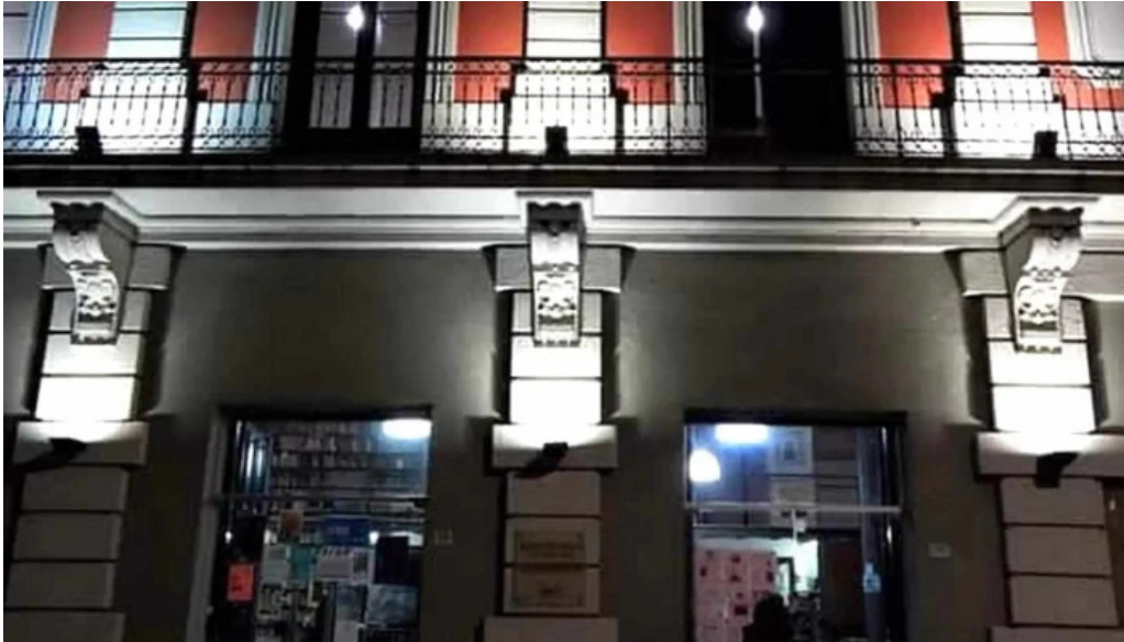
Centro cultural mem sitio web