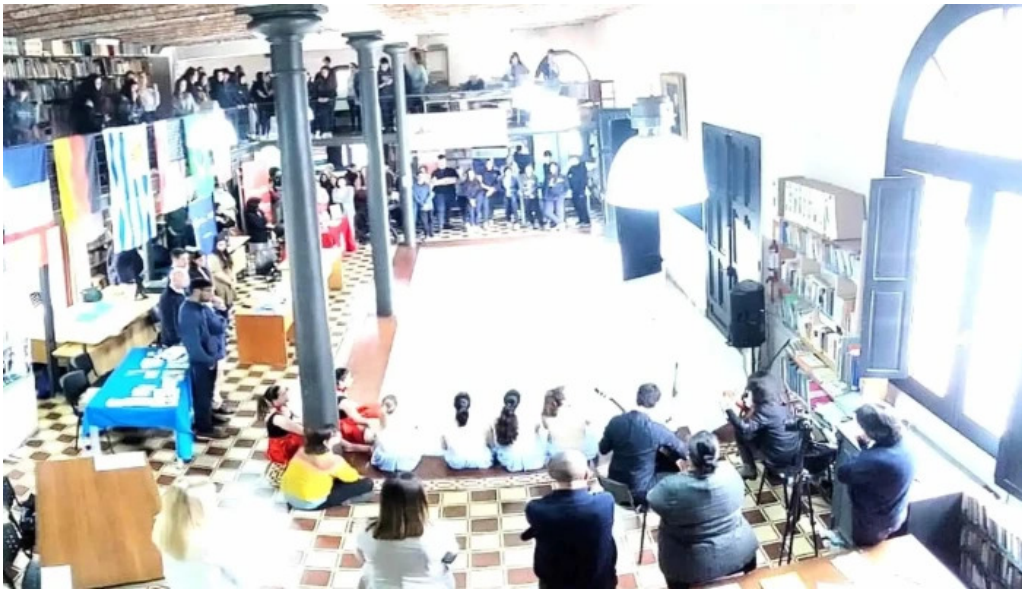
Centro cultural mem ubicacion