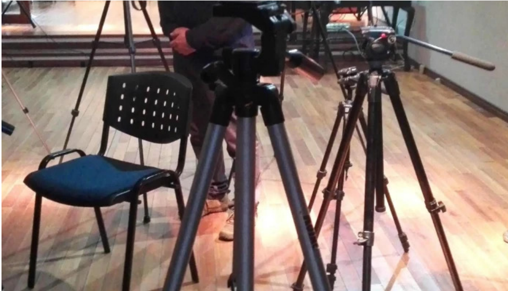
Centro cultural mem comentarios