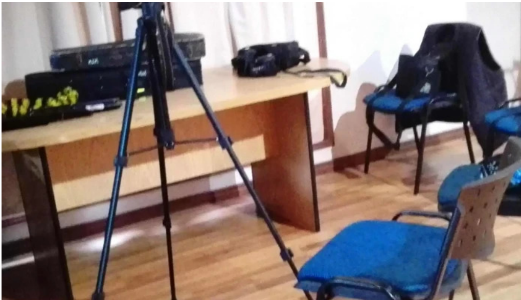
Centro cultural mem catalogo