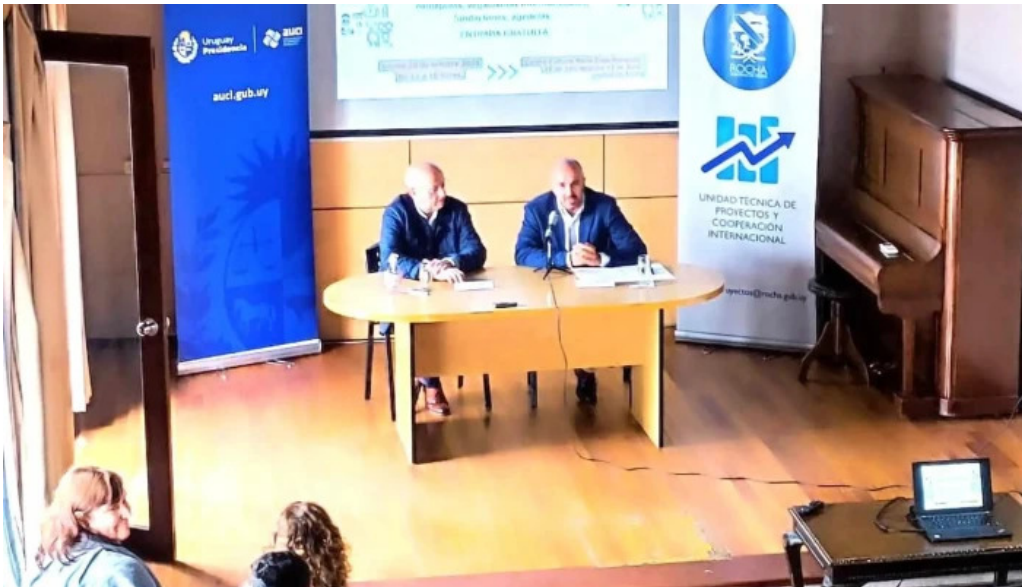
Centro cultural mem opiniones