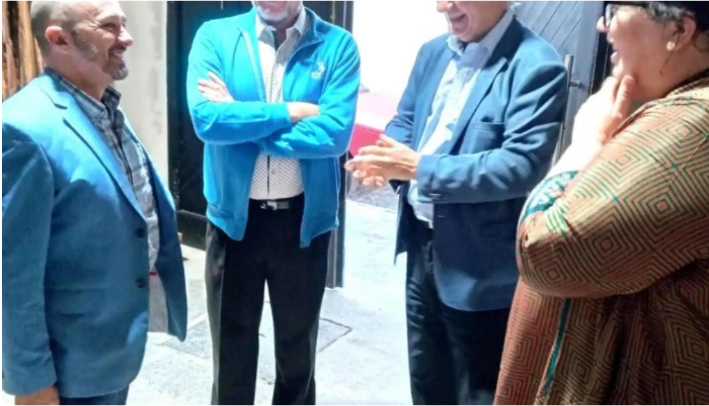
Centro cultural mem videos