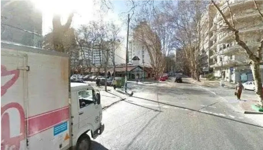
Juan benito blanco y jose marti como llegar