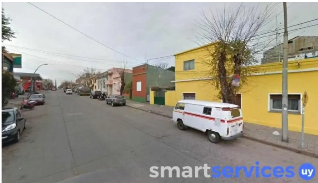
Entur treinta y tres