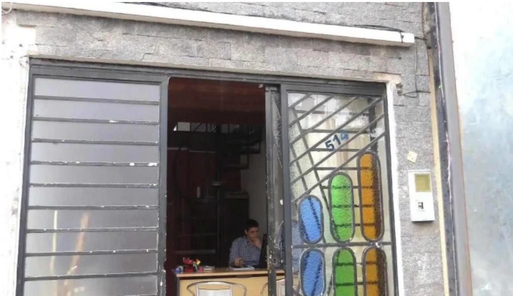
Marcan propiedades numero