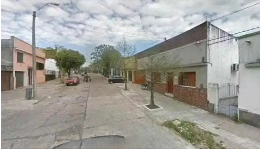
Marcan propiedades numero de g