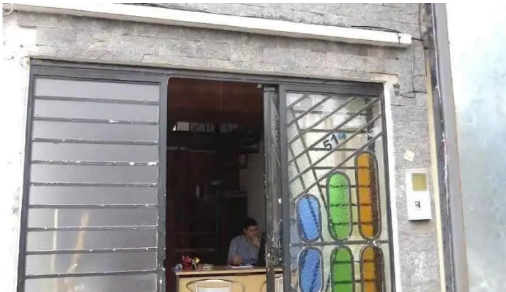
Marcan propiedades rivera