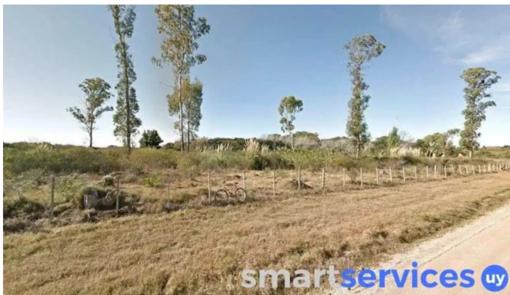
Paseos a caballos chincheta col del sacramento